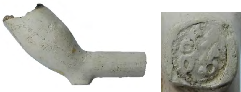
Afb. 23. Dubbelconisch model, hielmerk gekruiste sleutels met CA, hoogte 4 cm. Gouda/Leiden?, 1650-1675 (ZEE-ALG).