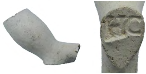
Afb. 1. Eerste-generatiepijp met snijfilt, druppelvormige hiel, hielmerk HC [incusie], hoogte 3,3 cm. Nederland/Engeland(?), 1590-1615 (MID-APT).