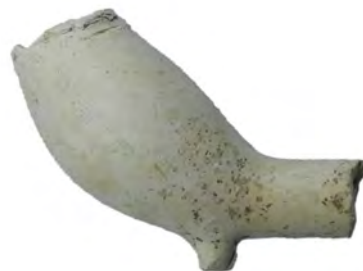
Afb. 37. Slurfvormige pijp met spoor, radering rond ketelopening, lengte 4,8 cm, hoogte 3,3 cm. Engeland, 1660-1690 (ZEE-ALG).