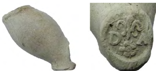
Afb. 13. Dubbelconisch model, hielmerk DA met lelie en roos, hoogte 3,3 cm. Gouda, 1635-1650 (ZEE-ALG).