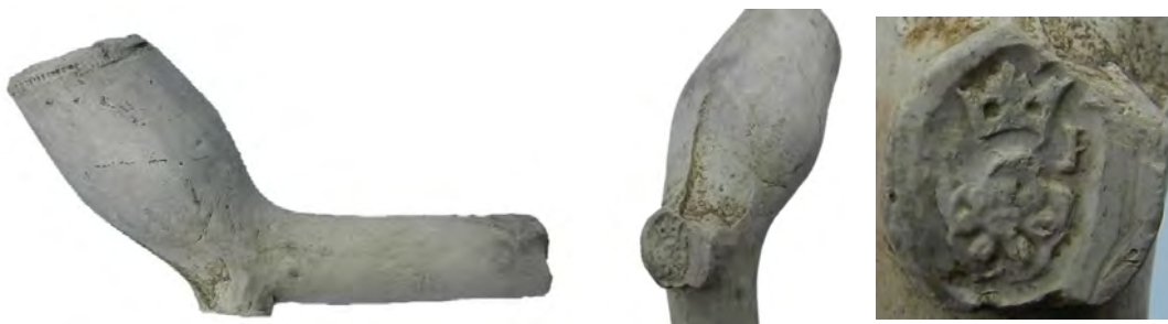
Afb. 27. Dubbelconisch model, hielmerk roos gekroond met SP of SF, hoogte 4 cm. Nederland, 1655-1680 (ZEE-ALG).