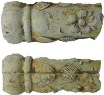
Afb. 34. Steelfragment dubbelconisch model met barokdecoratie, lengte 2,8 cm. Nederland, 1630-1640 (ZEE-ALG).