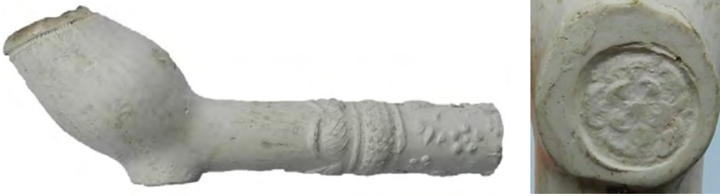
Afb. 16. Dubbelconisch model, hielmerk Tudorroos, hoogte 3,4 cm. Gouda?, 1635-1650 (MID-APT).