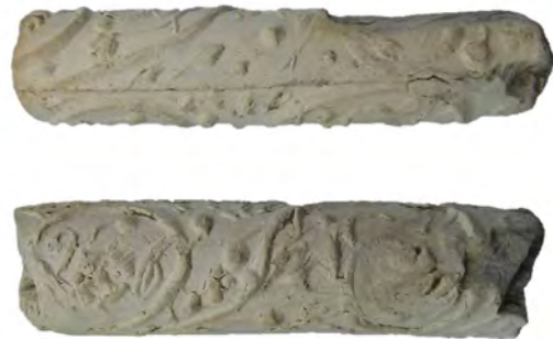
Afb. 35. Steelfragment dubbelconisch model met barokdecoratie, lengte 4,4 cm. Rotterdam(?), 1630-1650 (ZEE-ALG).