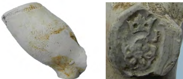
Afb. 26. Dubbelconisch model, hielmerk roos, hoogte 3,6 cm. Nederland, 1640-1660 (ZEE-ALG).