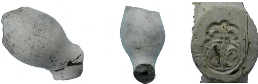
Afb. 25. Dubbelconisch model, schuin afgesneden filt, hielmerk half Tudorroos (links) en half lelie (rechts) gekroond binnen contour, hoogte ca 3,4 cm. Nederland, 1625-1640 (ZEE-ALG).