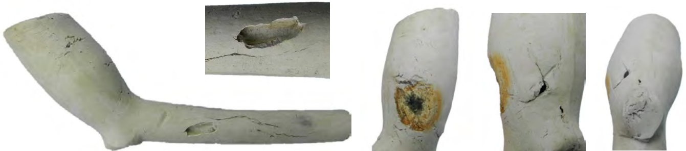
Afb. 33. Dubbelconisch model, misbaksel met scheefstaande kop, scheuren in steel en kop, gat in steel door meegebakken organische verontreiniging, meegebakken en geoxideerde verontreiniging in ketel, te ver doorgestoken weijer ongeglasd, ongemerkt, hoogte 4 cm. Zeeland(?), 1635-1650 (ZEE-ALG).