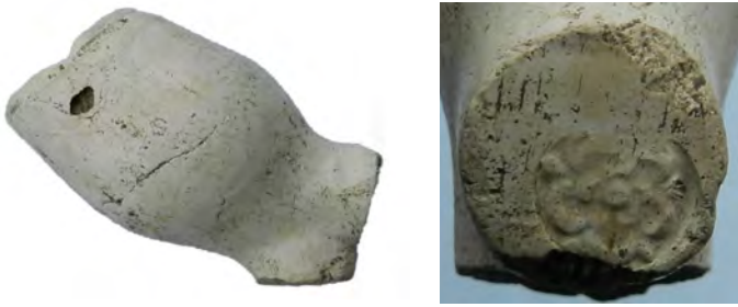
Afb. 24. Dubbelconisch model, hielmerk Tudorroos, hoogte 3,6 cm. Nederland, 1630-1640 (ZEE-ALG).