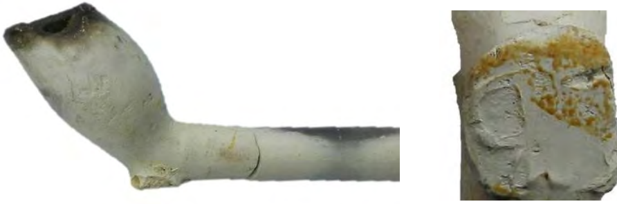
Afb. 28. Dubbelconisch model, hielmerk HD [ondersteboven gestempeld], steeldecoratie zes gestempelde dubbele lelies in ruit, hoogte 4 cm. Nederland, 1655-1680 (MID-APT).