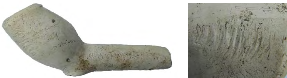
Afb. 31. Dubbelconisch model met krimpscheurtjes en sporen houten persvorm, ongeglasd, ongemerkt, hoogte 3,6 cm. Zeeland(?), 1635-1650 (ZEE-ALG).