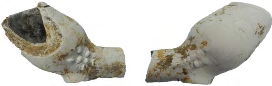
Afb. 32. Dubbelconisch model met gestileerde roos, ongeglasd, ongemerkt, hoogte 3,3 cm. Nederland, 1630-1640 (ZEE-ALG).