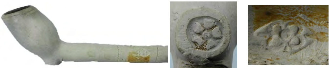
Afb. 19. Dubbelconisch model, hielmerk roos met vijf blaadjes, steeldecoratie twee groepjes van vier dubbele lelies met centrale stip in ruit en raderingen, hoogte 3,5 cm. Gouda, 1645-1660 (MID-APT).