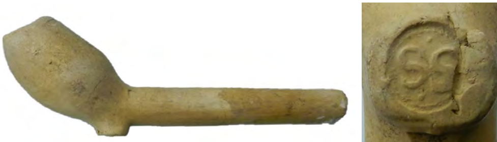
Afb. 29. Dubbelconisch model, hielmerk SS met twee stippen, hoogte 3,9 cm. Zeeland(?), 1650-1680 (MID-APT).