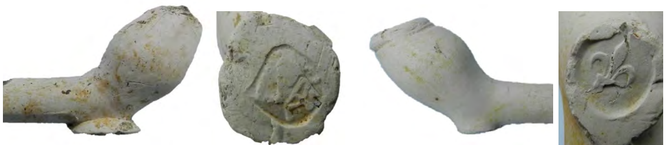
Afb. 4. Dubbelconisch model met grote ronde hiel, hielmerk RA gekroond (ondersteboven gestempeld), hoogte 3,4 cm. Rotterdam(?), 1620-1635 (ZEE-ALG).