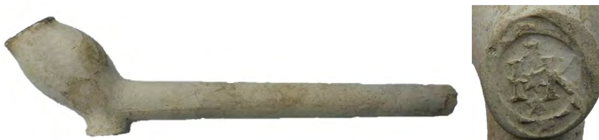
Afb. 22. Dubbelconisch model, hielmerk IK met drie sterren, hoogte 3,4 cm. Gouda/Leiden?, 1635-1650 (MID-APT).