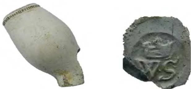
Afb. 15. Dubbelconisch model, hielmerk WS gekroond, hoogte ca3,6 cm. Gouda, 1635-1650 (ZEE-ALG).