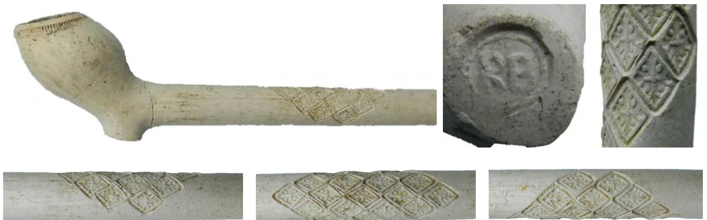
Afb. 3. Dubbelconisch model, hielmerk RB met stip, hoogte 3,4 cm. Rotterdam(?), 1620-1635 (MID-APT).