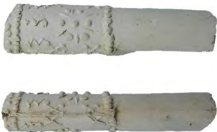
Afb. 36. Steelfragment dubbelconisch model met gestileerde roos en zigzagdecoratie, lengte 4,2 cm. Nederland, 1640-1680 (ZEE-ALG).