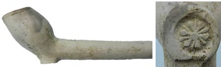
Afb. 20 Dubbelconisch model, hielmerk bloem met zes blaadjes en kelk, hoogte 3,1 cm. Gouda, 1645-1660 (MID-APT).