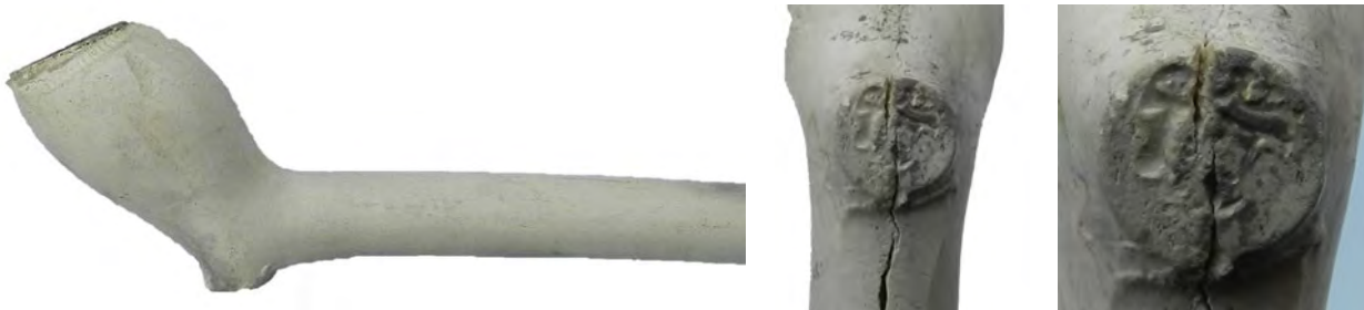
Afb. 2. Dubbelconisch model (scheur onderzijde), hielmerk IT gekroond met twee blaadjes [incusie], hoogte 3,4 cm. Nederland/Engeland(?), 1610-1625 (MID-APT).